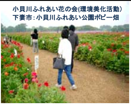
小貝川ふれあい花の会(環境美化活動) 下妻市:小貝川ふれあい公園ポピー畑