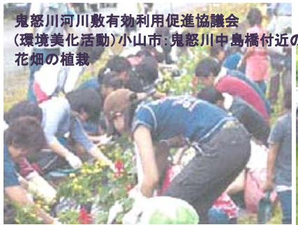
鬼怒川河川敷有効利用促進協議会(環境美化活動)小山市:鬼怒川中島橋付近の花畑の植栽