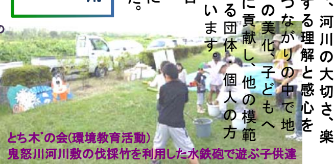
とち木の会(環境教育活動) 鬼怒川河川敷の伐採竹を利用した水鉄砲で遊ぶ子供達