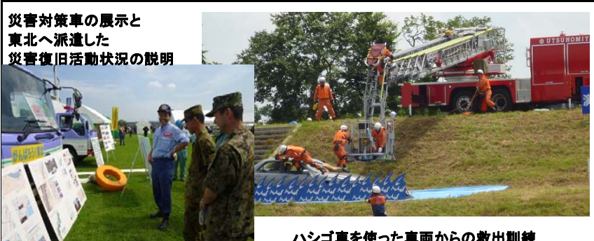
ハシゴ車を使った車両からの救出訓練

七月九日、宇都宮市道場宿河川敷にて、「宇都宮市水防訓練」が行われました。演習には約七百名の消防団が参加し、伝統的水防工法やハシゴ車を使った救出訓練が本番さながら実施されました。下館河川事務所は、排水ポンプ車や照明車などの災害対策車の展示や、東日本大震災で東北地方へ派遣された排水ポンプ車の活動内容などをパネル展示して説明を行いました。