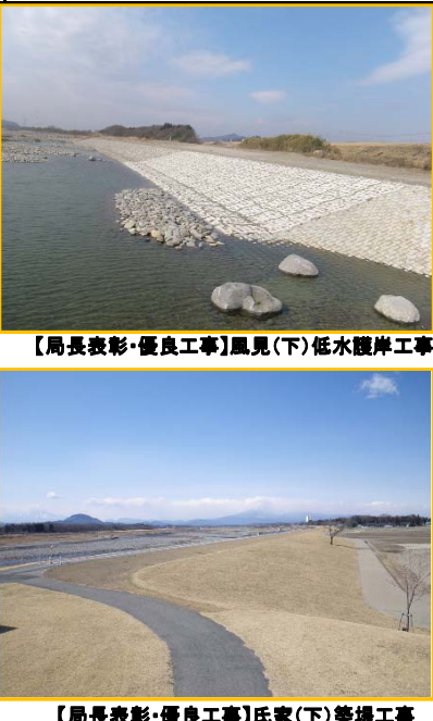
【局長表彰・優良工事】風見(下)低水護岸工事

平成二十三年七月十五日(金)、下館河川事務所において「平成二十二年度下館河川事務所優良工事等表彰式」を執り行いました。今回の表彰は、平成二十二年度に完成・完了した中で特に優れた成績をおさめた工事、業務、技術者等について、事務所長表彰を行い、技術の向上及び円滑な事業の推進に資することを目的としたものです。