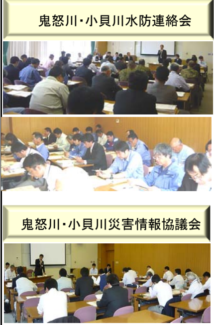
鬼怒川・小貝川災害情報協議会

五月十八日（水）平成二十三年度国土交通省下館河川事務所「鬼怒川・小貝川水防連絡会」が筑西市内で開催され、鬼怒川・小貝川流域の県・市町・水防組合・陸上自衛隊・警察・国土交通省などで重要水防箇所・洪水予報及び水防警報関係・水防対策の広報や各種情報伝達系統などについて、確認や情報提供及び意見交換を行いました。下館河川事務所からは、平成二十三年三月十一日の東北地方太平洋沖地震で被災した箇所を重要水防箇所を含めていることや小貝川の今出水期における「氾濫注意水位」や水防団待機水位の見直しについてなどの説明を行いました。また、「平成二十二年の天気と今年の夏の予報」と題して宇都宮地方気象台による講演も行われ、関係機関が情報を収集し出水期に備えています。同日午後からは、「鬼怒川・小貝川災害情報協議会」が開催されました。洪水による被害の軽減を計るためには、ハザードマップによる平常時からの啓発が重要であるため、ハザードマップ関連の確認や情報提供などの支援を行っています。