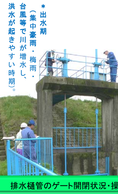
排水樋管のゲート開閉状況・操作点検中

今年度の検査にあたっては、平成二十三年三月十一日（金）の地震をはじめとする東日本大震災の発生により、各施設の被災状況の再把握と洪水への対策について具体的な確認し、対策が必要な箇所について改善を図るよう指摘し、出水期に備えています。