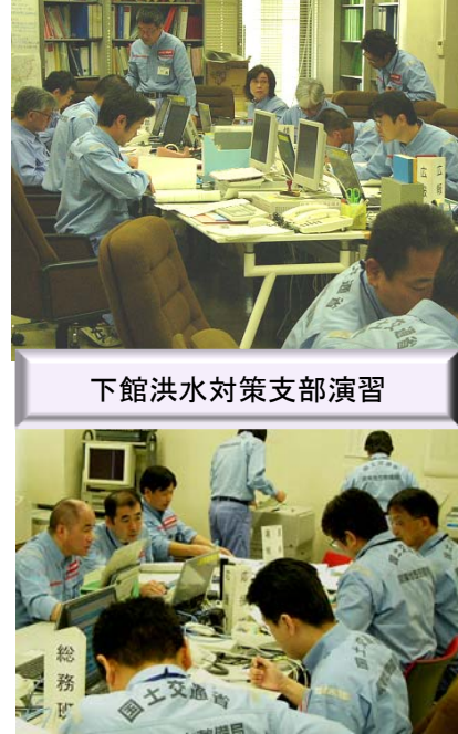
下館洪水対策支部演習

毎年、下館河川事務所では出水期前に関係自治体やダム管理者と一緒に洪水時における洪水予測の実施、水防関係機関等への水防警報・洪水予報等の情報伝達や洪水被害軽減のための対策工法の検討等の実践的な演習を行い、防災体制の確認を行い洪水時に万全を期するを目的として「洪水対応演習」を実施しています。