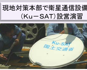
現地対策本部で衛星通信設備（Ku-SAT）設置演習

今年度は五月二十五日（水）に、洪水を想定し、関係機関への各種情報の伝達、被災箇所の復旧工法の検討等を実施しながらに行いました。当演習によって得られた体験や問題点・改善すべき点の対策を検討し、洪水対応に生かして参ります。