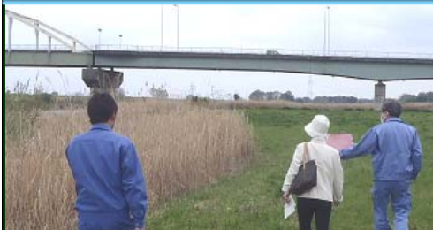
河川愛護モニターと一緒に点検