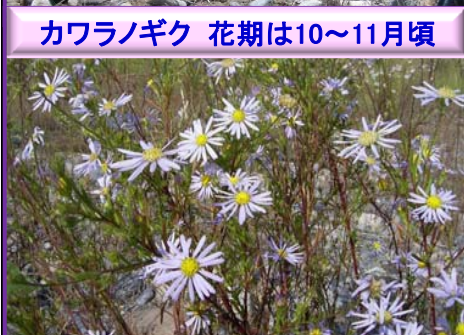
カワラノギク 花期は10~11月頃