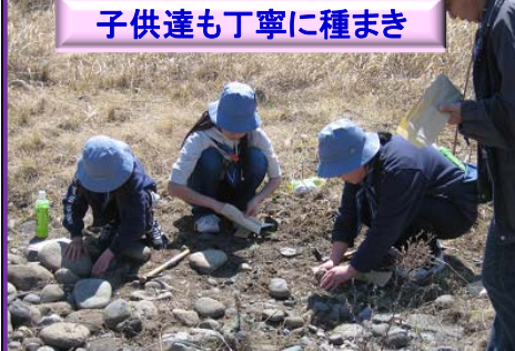
子供達も丁寧に種まき

鬼怒川の特徴である礫河原には、その環境に適応した生物(礫河原固有生物)が生息・生育しています。外来植物シナダレスズメガヤの繁茂などにより、鬼怒川中流部の礫河原環境は、近年急速に減少しています。鬼怒川の砂礫質河原を特徴づける河原固有植物の「カワラノギク」も絶滅危惧種となっています。