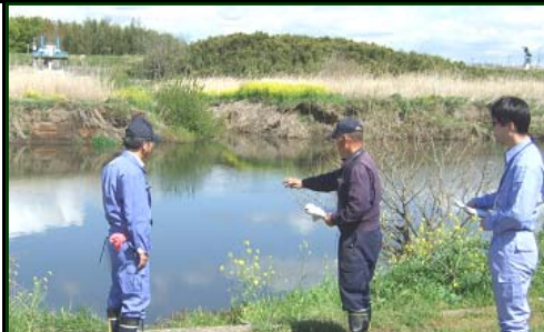
水ぎわの安全点検中

下館河川事務所管内では、河川の利用者が多くなる五月の連休前と夏休み前に職員自ら水辺周りや階段、堤防や護岸等多くの方が利用される箇所について安全利用点検を行い、危険箇所についての改善や対策を実施し、河川に訪れる方が河川を安全に利用できるようにしています。今回は四月八日、二十二日に管内各出張所で点検が行われ、特に黒子出張所や鎌庭出張所では、河川愛護モニターの方の同行で、利用者の目線から、河川利用者からの声を聞きながら点検を実施し、河川の安全な利用のために必要な事項を具体的に再確認できました。なお、点検の結果危険箇所については、注意喚起看板等の設置等対策を実施しました。引き続き河川利用者が安全に川に接する事ができるよう、点検等を実施していきます。