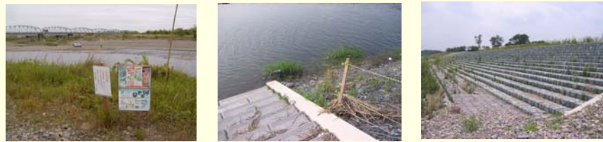
水際注意看板 水際 階段護岸

「今年も鬼怒川で「カワラノギク」の種まきが行われました」 四月十八日（日）に、勝山地区の河川事務所管内の各点検箇所において、関係機関やボランティアなど、約100名が参加し、点検作業を行った。点検内容は、堤防の傾斜や亀裂の有無、護岸の崩壊の有無、水生植物の発生状況などである。関係機関やボランティアの協力を得て、安全な河川環境を維持・管理していくことが重要である。関係機関やボランティアの協力を得て、安全な河川環境を維持・管理していくことが重要である。