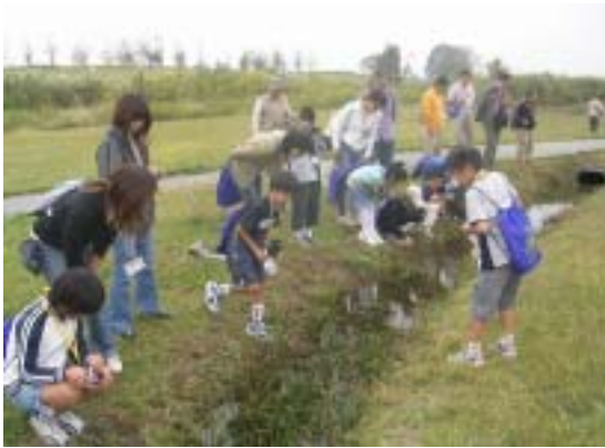
観察緑地の小川でメダカを確認!!