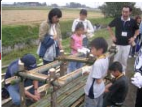
河内町自然環境研究会の方々の指導のもと、 「さかなの駅」づくり