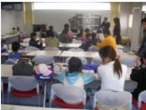
パックテストにチャレンジ 時間はちゃんと計ってね。