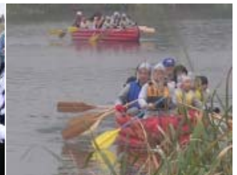
雨にも負けず・Eボート体験 思うように進まないね!

平成17年10月15日(土)、22日(土)に鬼怒川・小貝川流域内の親子対象とした「上下流交流・鬼怒川楽習会」が開催されました。参加者は親子合わせて38名、茨城県利根町から栃木県南那須町までの方々が集まってくれました。