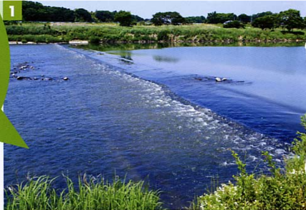
第二床止め工(上流部)

大形橋の上流部で蛇行していた水路がショートカットされ、現在のような真っ直ぐな水路(捷水路)になったのは昭和10年(1935)のことです。