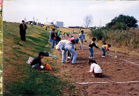
ハーブフローの種まき