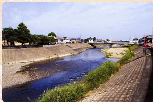
ふだんの川渡御の場所。浅くても大丈夫、祭りの前に調整するんです