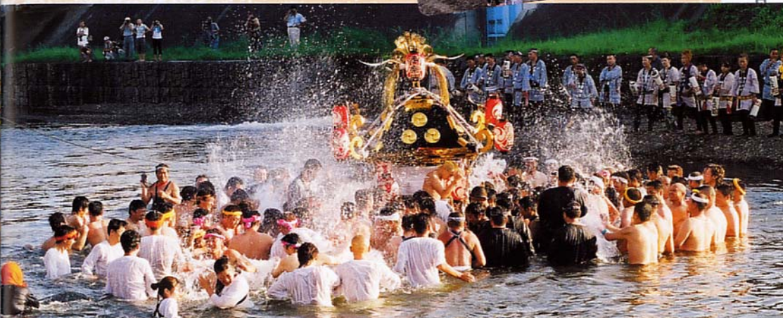
川渡御は興奮のるつぽ