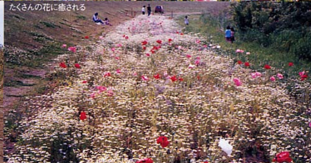
たくさんの花に癒される