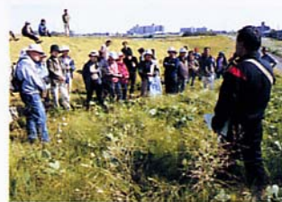
薬草観察会で説明に聞き入る参加者のみなさん

それではじめて、ヨシキリなどの鳥たちとか、その向こうにいる魚たちなどの全体が、一つの生態系としてつながりを持てる。そういうかたちで、ハーブフローを残していきたいというのが、一番大事にしている点です。