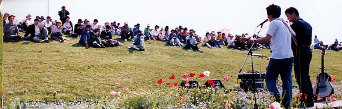
ハーブフローのつどい、フラワーコンサート