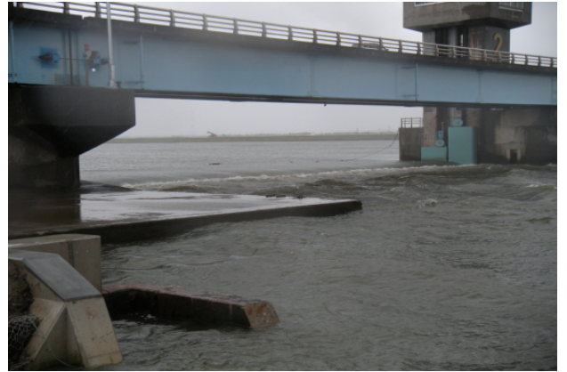
下流側から見た利根川河口堰の様子。堰上流と下流の水位差で、速く複雑な流れになっており、大変危険です。

水難事故にあわないためにも、船舶を運航する際は事前に経路を確認し、危険箇所や通航制限区域などを避けていただくようお願いいたします。