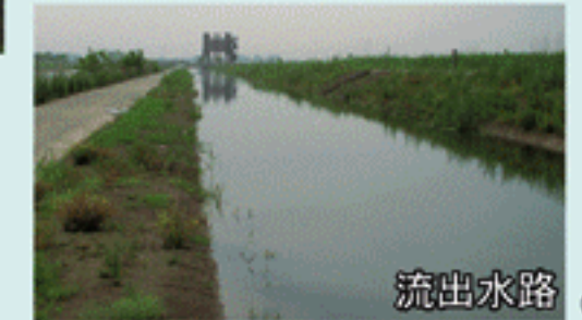
流出水路 (東ブロック)

渡良瀬遊水地ウォッチングタワーは、第1調節池のほぼ中央に位置し、渡良瀬遊水地全体を見渡せる施設です。1階部分はオープンスペース、2階部分はヨシ原浄化施設の制御室、屋上部分は展望施設となっています。屋上には3基の大型双眼鏡が据え付けられており、ヨシ原浄化施設をはじめ、渡良瀬遊水地全体、さらに空気の澄んだ日には遠く富士山や、日光男体山、筑波山などもよく見えます。