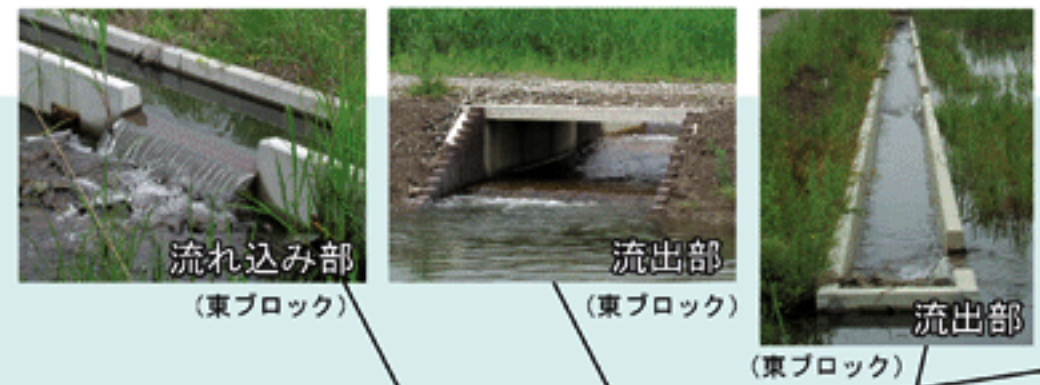
流れ込み部 (東ブロック)