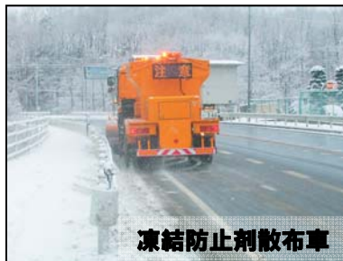
凍結防止剤散布車