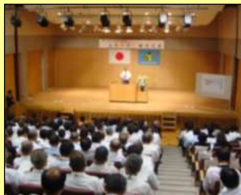
第19回「治水の日」継承式典 (平成23年9月16日)

利根川上流河川事務所では、カスリーン台風の甚大な災害の教訓を踏まえ、その記憶を後世に語り継ぐとともに、犠牲者のご冥福を祈り、利根川の治水事業の重要性を広く理解して頂くことを目的として、平成4年度から利根川の堤防が決壊した日である9月16日を「治水の日」と制定し、以来、毎年この時期に「治水の日」式典を開催しています。今年も下記のとおり「治水の日」式典を行います。