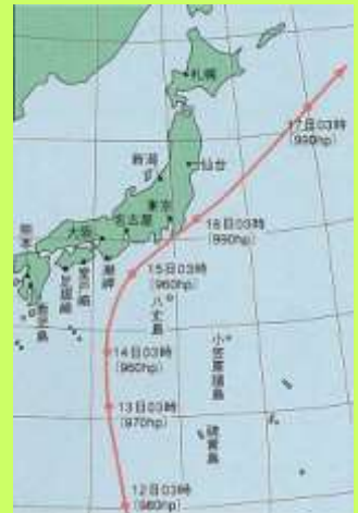
カスリーン台風の進路