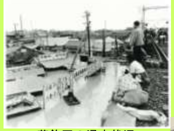
葛飾区の浸水状況

濁流は埼玉県のみならず東京都にまで達し、利根川水系における戦後最大の水害となりました。