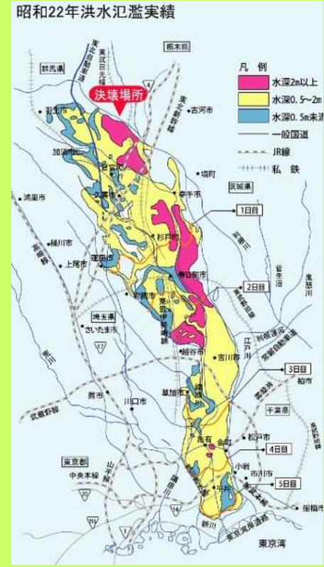
昭和22年洪水氾濫実績