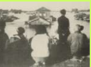
久喜市(旧栗橋町)沈んだ我が家を堤防上から見つめる人々