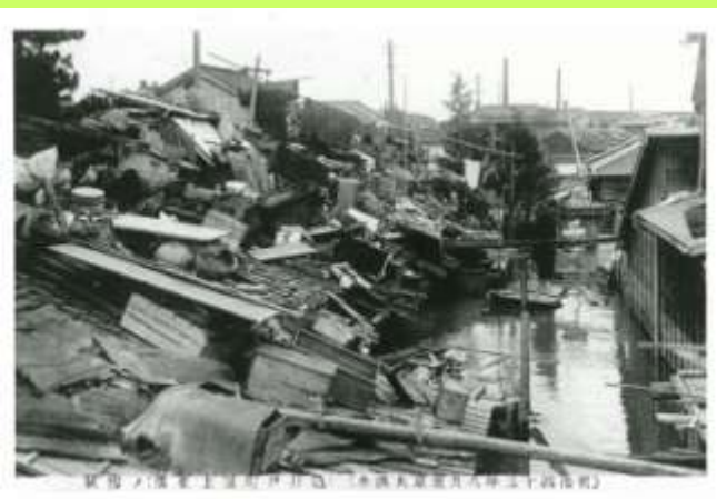
亀井戸町屋上生活の惨状 (現在の江東区)