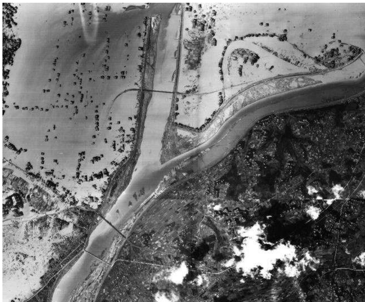
カスリーン台風の爪痕 決壊箇所周辺の空中写真