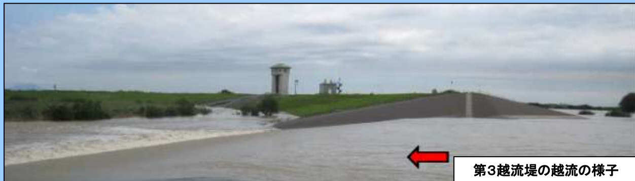
第3越流堤の越流の様子

このため、思川の乙女水位観測所では、避難判断水位(注1)を超える程水位が上昇しました。また、渡良瀬遊水地(3調節池)では、東京ドーム約8個分(約1,000万m 3 )の洪水量を貯水しました。