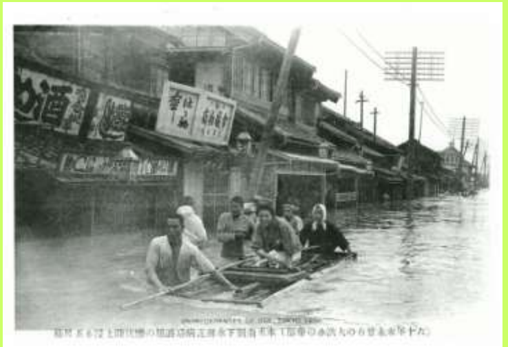
本所南割下水付近病院避難の惨状 陸上浸水五尺余 「五尺(約1.5m)を超える水位の中の避難」 (現在の墨田区)