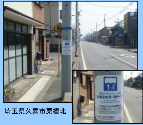
埼玉県久喜市栗橋北

見つけた方は、当時の水害の大きさを再確認していただき、日頃から洪水への意識を高めて頂ければと思います。