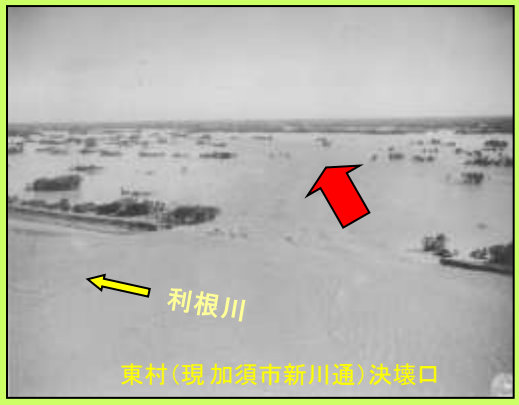
利根川 東村(現加須市新川通)決壊口