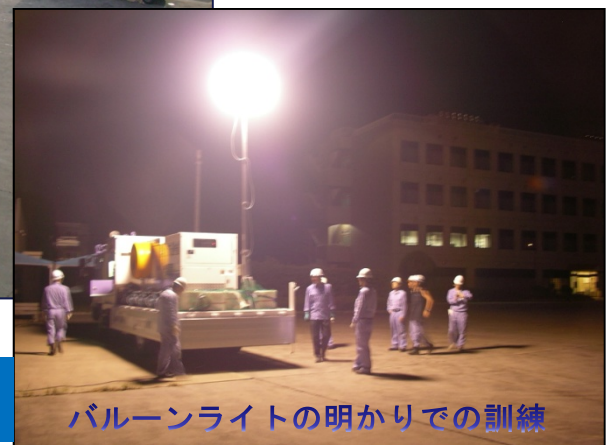
バルーンライトの明かりでの訓練