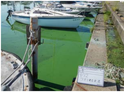
水馬アオコ発生状況①