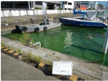
作業船によるアオコ攪拌作業①