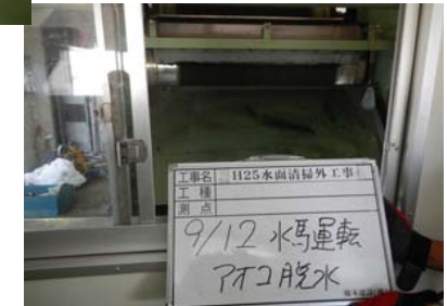
水馬脱水アオコ3本