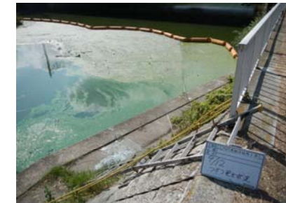
作業船によるアオコ攪拌作業③