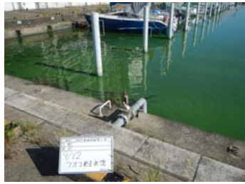
作業前アオコ発生状況①