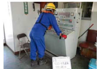
水馬脱水アオコ3本