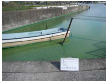
作業前アオコ発生状況③