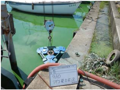
水馬アオコ発生状況①