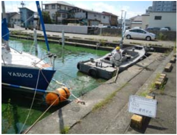
作業船によるアオコ攪拌作業②