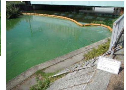
作業船によるアオコ攪拌作業④