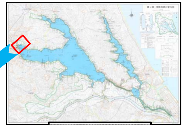
作業前アオコ発生状況④