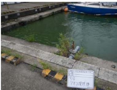
アオコ攪拌作業後①