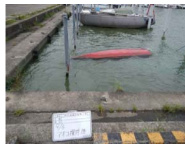
アオコ攪拌作業後②