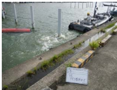
作業船によるアオコ攪拌作業②