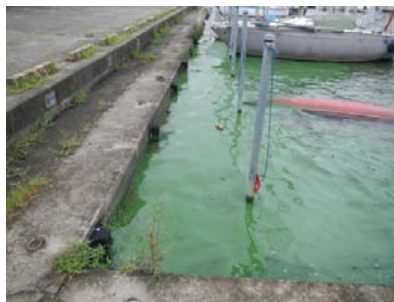
作業前アオコ発生状況②