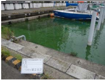
作業船によるアオコ攪拌作業①