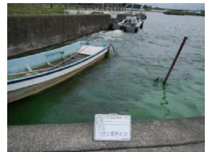
アオコ攪拌作業後③