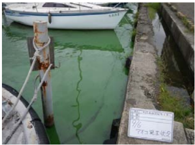
水馬アオコ発生状況①