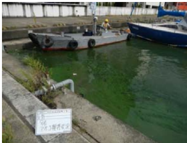
アオコ攪拌作業後①