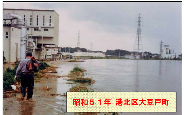
昭和51年 港北区大豆戸町