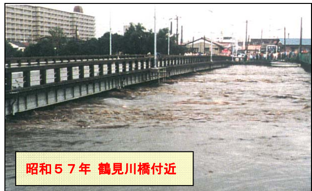
昭和57年 鶴見川橋付近