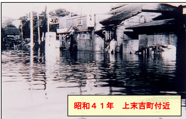
昭和41年 上末吉町付近