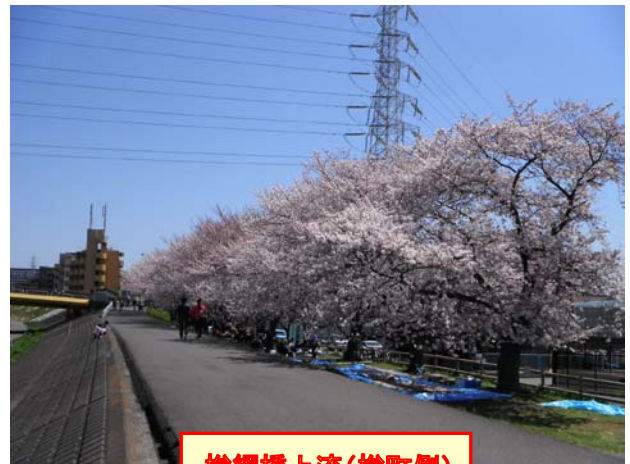
樽綱橋上流(樽町側)