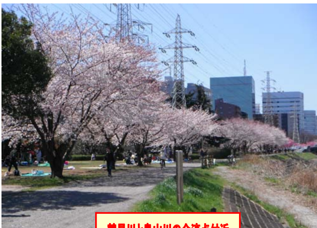
鶴見川と鳥山川の合流点付近