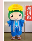
桶川市「オケちゃん」