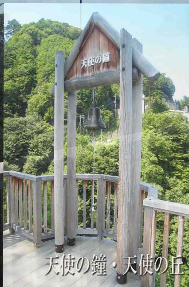
天使の鐘・天使の丘