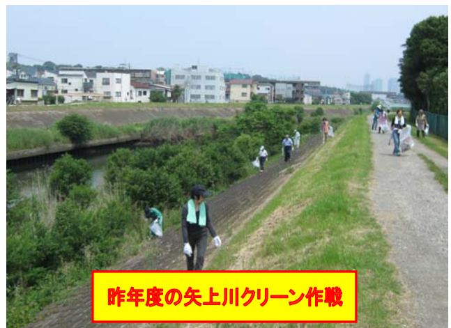
昨年度の矢上川クリーン作戦