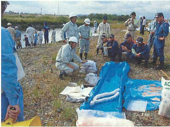
小水路での油対処の注意点講