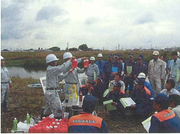
水質事故対策の基礎講義