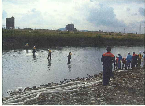
オイルフェンス展張訓練