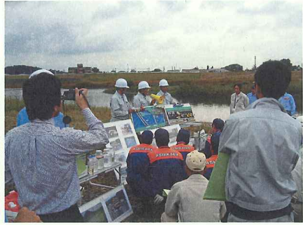
水質事故対策の基礎講義