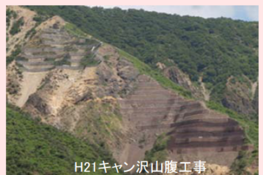
H21キャン沢山腹工事