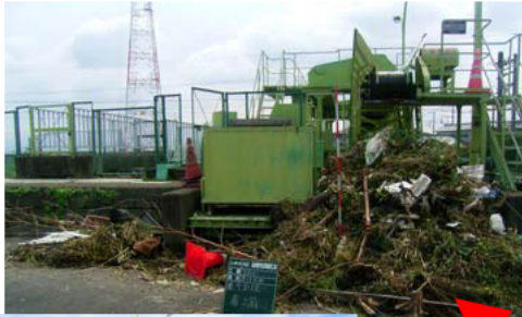
大雨で川に流れてくるゴミの例