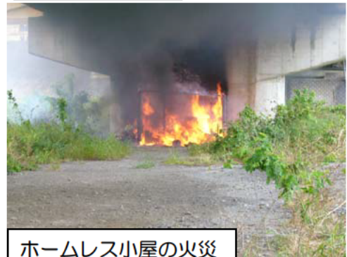
ホームレス小屋の火災