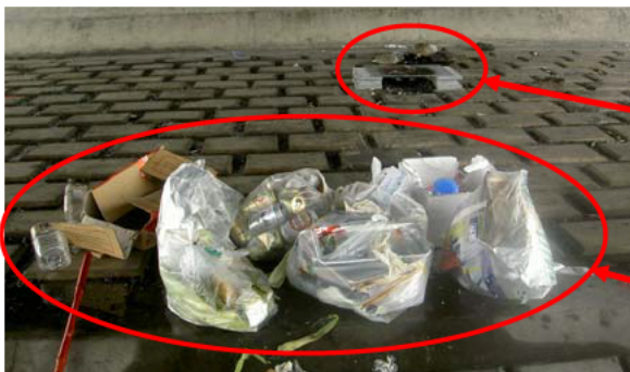
ディキャンプあとのゴミの投棄例

このため足利出張所では、定期的に河川内のゴミの収集・処分を行っています。それでもゴミの量が減ることはありません。このため、河川を利用する場合には、ゴミを持ち帰って「きれいな川づくり」ご協力ください。