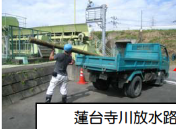
蓮台寺川放水路除塵機 (流れてくるゴミをとる機械)

渡良瀬川の支川である蓮台寺川は、足利市内を流れる小さな川ですが、空き缶、ペットボトル等の普通のゴミ以外にも、タイヤ、炊飯器など、意図的に捨てられたゴミが流れてきており、大雨になるとゴミ等により、川の流れが悪くなり上流側の水位が上昇して、災害の危険性があります。