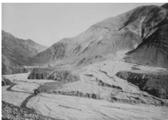
〔↑〕 かつての松木周辺の風景。

また、荒廃地である松木溪谷においても、わずかの木々ではありますが、見事に紅葉し、少しずつですが着実に緑の回復が進んで来ています。