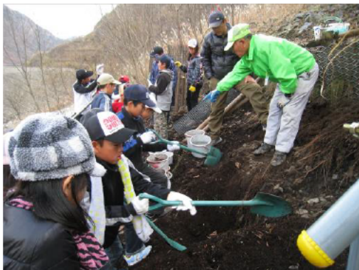
11月も寒さに負けず頑張ってくれました。