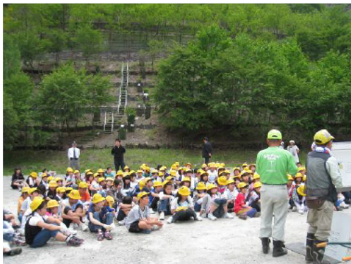
多くの小学生が植樹に参加してくれました。