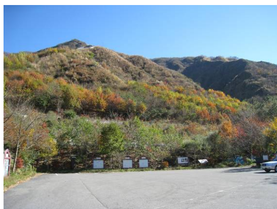
〔↑ ↓〕 大畑沢砂防ゾーンの紅葉です。