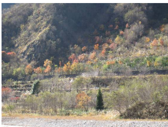
〔↑ ↓〕 松木体験植樹箇所の紅葉です。