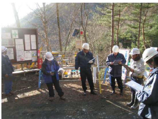
パトロールの前に工事概要を説明。

工事施工中は、何かとご迷惑をお掛けすることもあります。何卒、ご協力を賜りますよう、よろしくお願い致します。