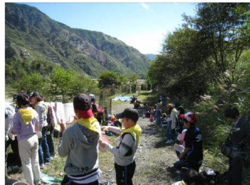
観察手帳をつける生徒さん。