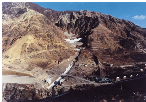
〔↑〕 かつての大畑沢周辺の風景。