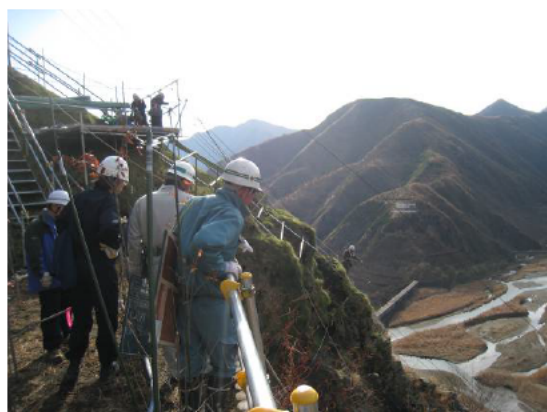
作業中の現場パトロール風景です。