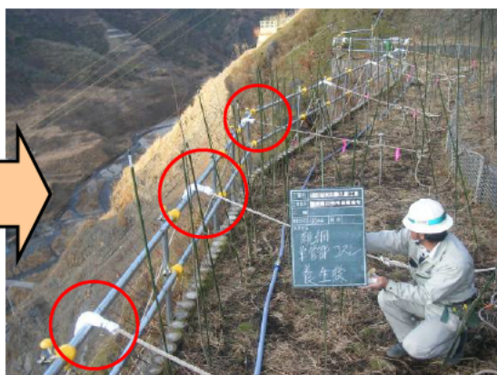
（左）是正前（右）是正後〔命綱と鉄パイプが接する部分を保護しました。〕