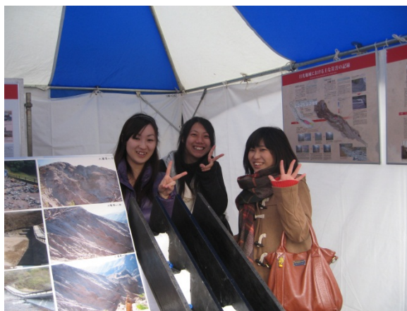
事務所の女性陣も応援に来ました。