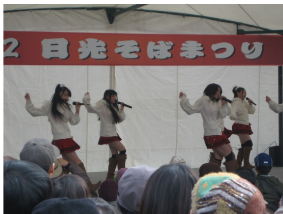
メイン会場では、「とちおとめ25」のイベント等で盛況でした。