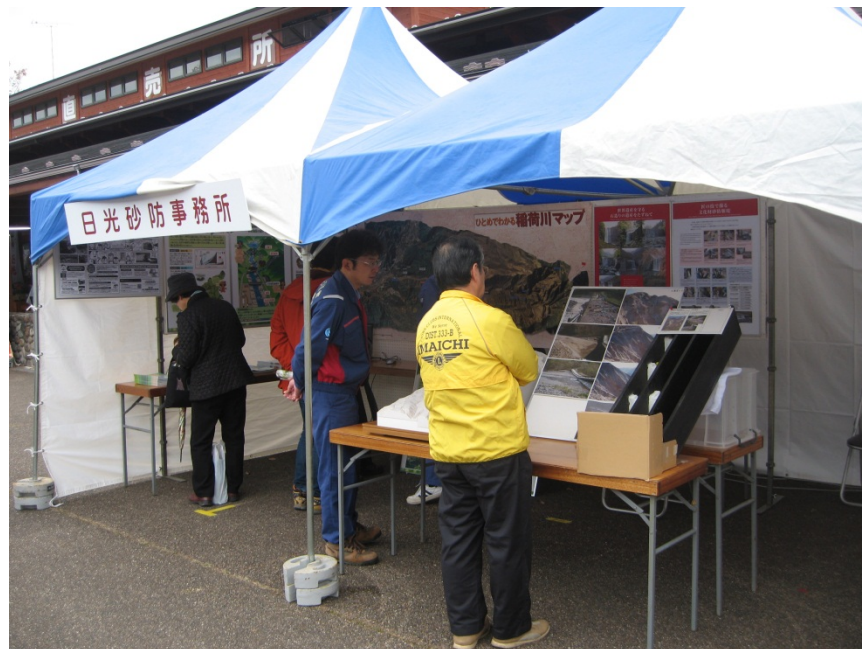
稲荷川源頭部の状況写真や、1/5000立体地形モデル、連続砂防堰堤模型、パネル展示等を実施。