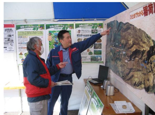
稲荷川の空中写真には、地元の方々も興味津々でした。