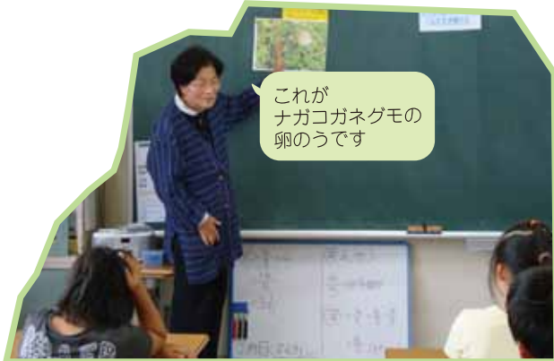
これがナガコガネグモの卵のうです

卵が入っている袋のことを「卵のう」と言います。ナガコガネグモのメスは、秋に、お尻から出した糸で、まず膜をつくり、そこに卵を産みつけ、周りを糸でぐるぐるで袋状にします。秋にはたくさん子グモがかえり、寒い冬の間は、この卵のうの中で過ごし、春に風に乗って旅立っていきます。