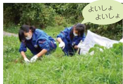
よいしょ よいしょ

木道の脇をよく見ると、新しく生えてきたセイタカアワダチソウの若い芽がたくさん。竹の棒を使い、若い芽を根っこごと取り除きました。こうした地道な作業が三ツ又沼ビオトープの貴重な自然を守っているのです。