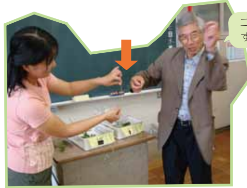
二人で協力すれば…

三角形の茎をしているカヤツリグサは、ある方法で四角形になります。さて、どうやるのかな？二人でカヤツリグサの茎の両端をもって、一人は三角の茎に対して縦に(▲)、もう一人は横に(△)、両側からゆっくり裂いてごらん。ほら、四角形になったよ。