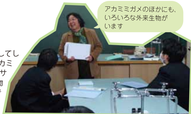
アカミミガメのほかにも、いろいろな外来生物がいます

外来生物は、日本にもともといる生きものたちを追い出したり、農作物を荒らしたりしています。例えば、アカミミガメというカメは、日本にもともといたイシガメやクサガメの居場所をうばってしまいます。もしも、外来生物を飼っている、または飼う予定があるのなら、最期までしっかり面倒をみてください。絶対に野外に放してはいけませんよ。