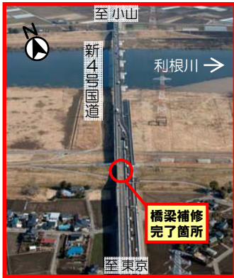
[五霞町付近から小山方面を望む] H23.2月撮影