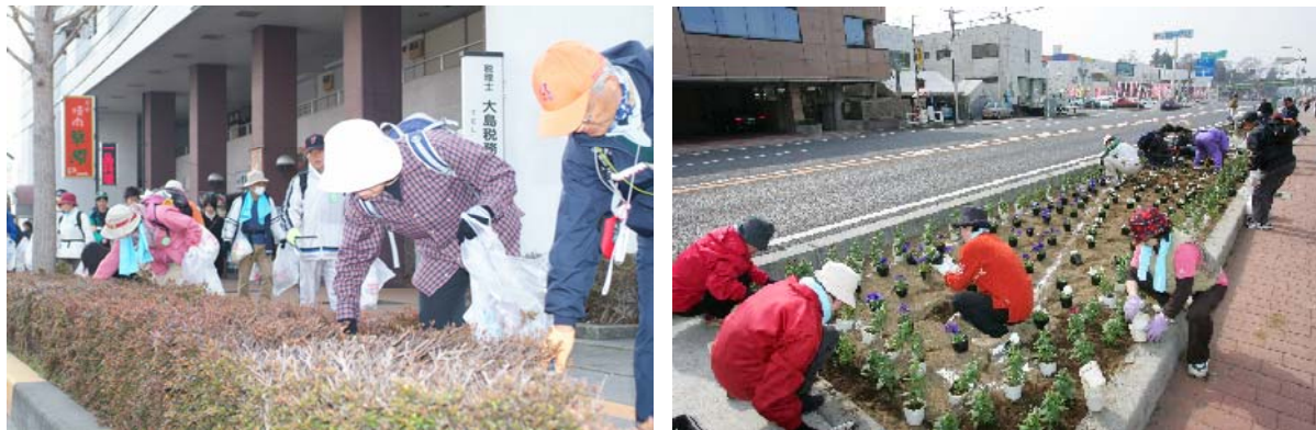
昨年度開催の様子