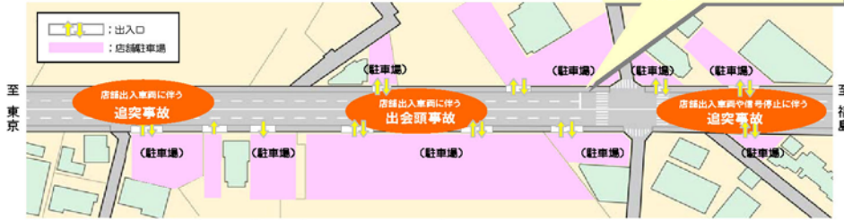
国道4号御幸町付近における交通事故発生状況(H13~15年事故から)

問:国道4号の御幸町での事故が多く発生していますが、危ないと感じたことがありますか?