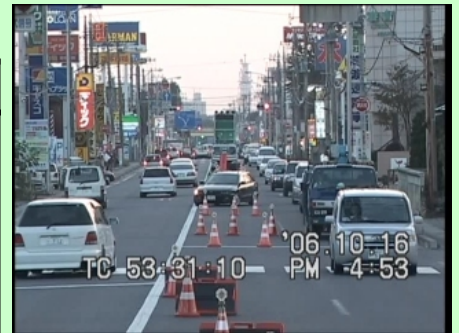
沿道施設出入り車両の右折待機状況 (規制実験時)