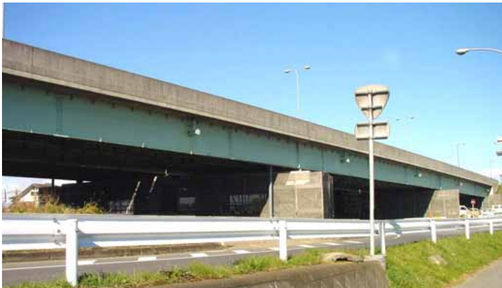
とちの実橋現況写真

そこで「とちの実橋」が道路利用者や地域の皆さまに愛着を持って受け入れて頂くことを願い、皆さまのご意見も参考にしながら色彩を決定していきたいと考えておりますので、アンケート調査にご協力願います。