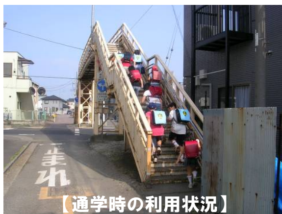
【通学時の利用状況】