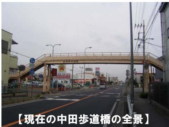
【現在の中田歩道橋の全景】

歩道橋を通学路とする市道が歩道未整備の狭小な道路で危険な状況にあることから、古河市において通学路安全対策を目的とした通学路変更の計画と併せ、歩道橋の架け替えを実施しました。