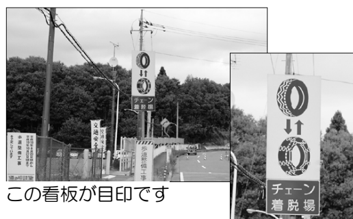
この看板が目印です