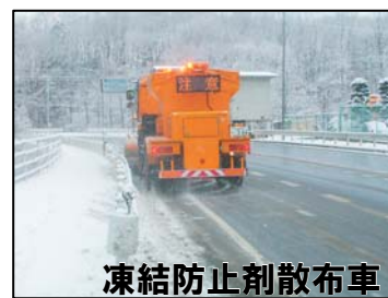
凍結防止剤散布車

積雪時には、除雪作業をする車両が走行したり、凍結防止剤を散布する車両が低速で走行しています。皆様の安全を守るための作業です。ドライバーの皆様にはご迷惑をおかけしますが、無理な追い越しは危険ですので、ご協力をお願いします。