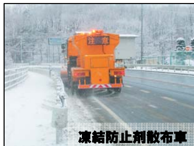
凍結防止剤散布車