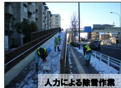
人力による除雪作業

積雪時には、除雪作業をする車両が走行したり、凍結防止剤を散布する車両が低速で走行しています。また、歩道においては、人力による除雪作業も行います。皆様の安全を守るための作業です。通行者の皆様にはご迷惑をおかけいたしますが、ご協力をお願いします。