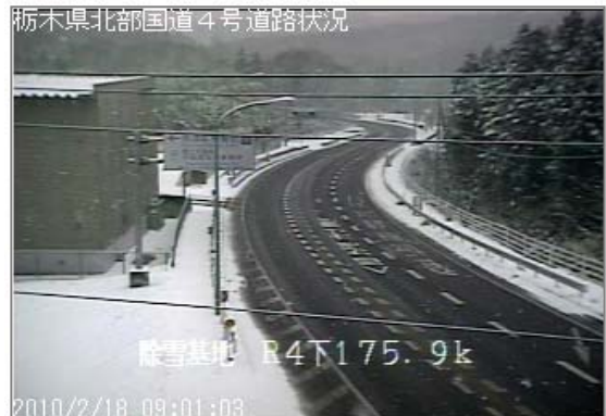
栃木県北部国道4号道路状況

※一部の機種では読み取れない場合があります。 その際はお手数ですが、携帯サイトのURLからアクセスしてください。