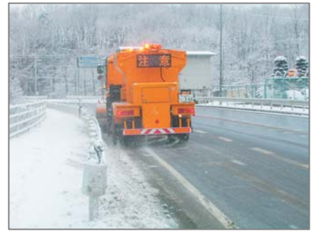
凍結防止剤散布車

○除雪グレーダ・除雪トラック：主に、新雪を路肩にかき寄せて、安全な車道を確認する目的で使用する車両です。