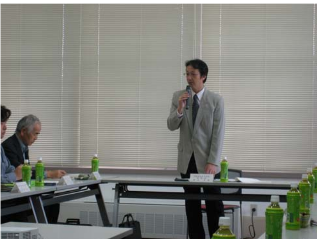
森本委員長あいさつ