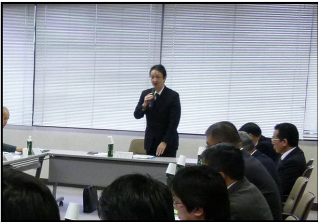
森本委員長あいさつ