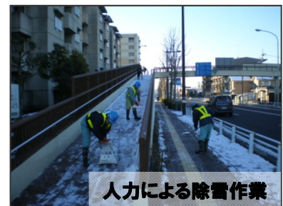
人力による除雪作業

積雪時には、除雪作業をする車両が走行したり、凍結防止剤を散布する車両が低速で走行しています。また、歩道においては、人力による除雪作業も行います。皆様の安全を守るための作業です。通行者の皆様にはご迷惑をおかけいたしますが、ご協力をお願いします。