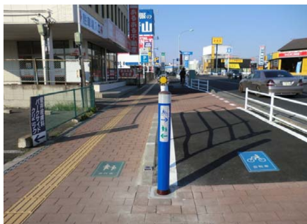
完成又は施工状況写真