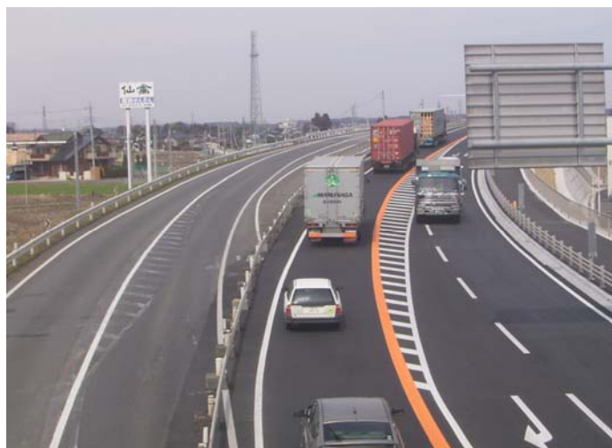
完成又は施工状況写真