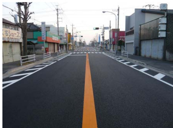
施工箇所(間々田地区)