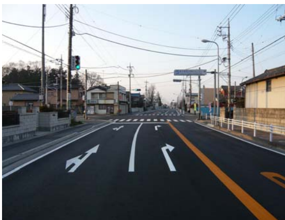
施工箇所(野木地区)