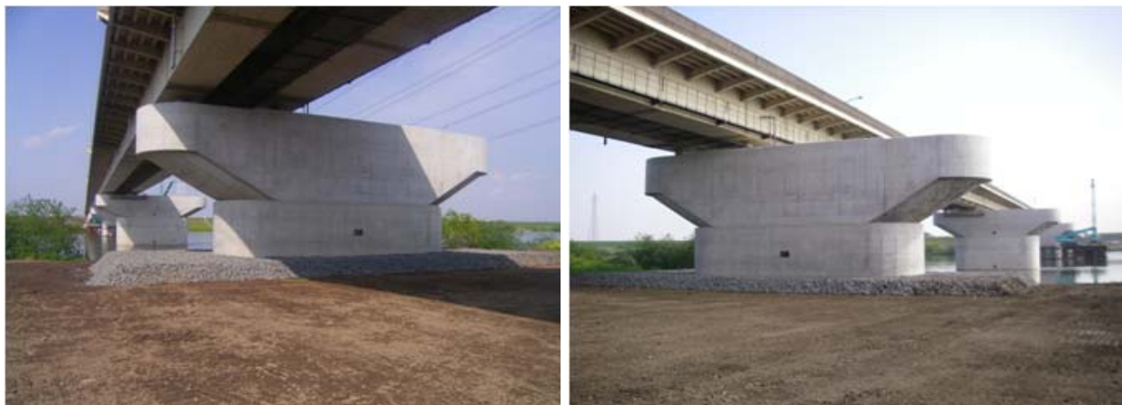
完成又は施工状況写真