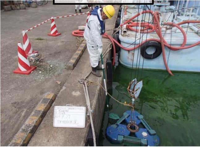
水馬アオコ回収状況①