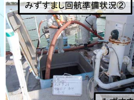
みずすまし回航準備状況②