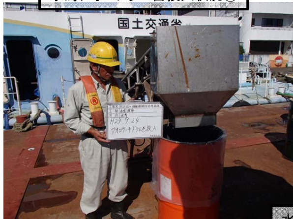
水馬アオコドラム缶投入状況①