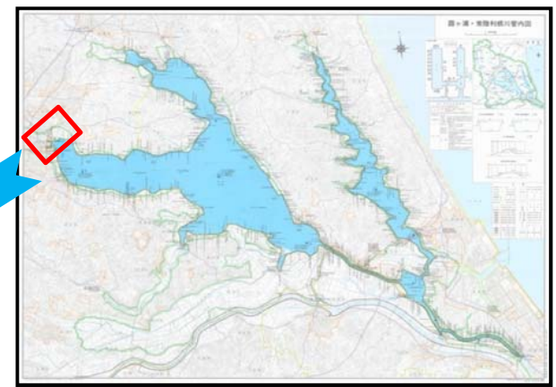
みずすまし回航準備状況②