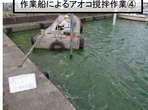
作業船によるアオコ攪拌作業④