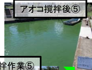
作業船によるアオコ攪拌作業⑤