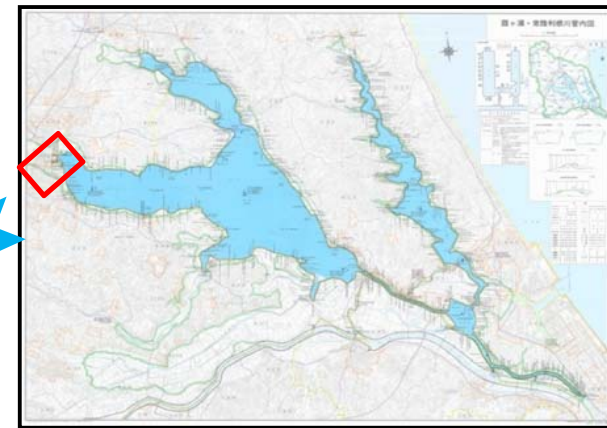
作業船によるアオコ攪拌作業④