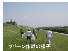
クリーン作戦の様子