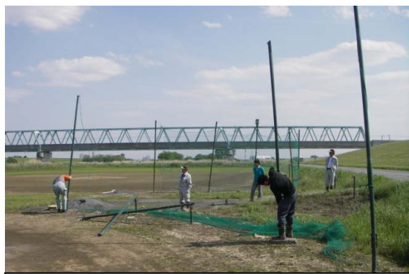
履行検査での野球ネット撤去確認状況