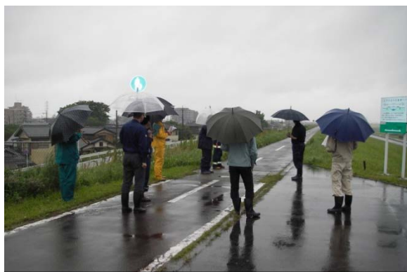
江戸川の巡視状況