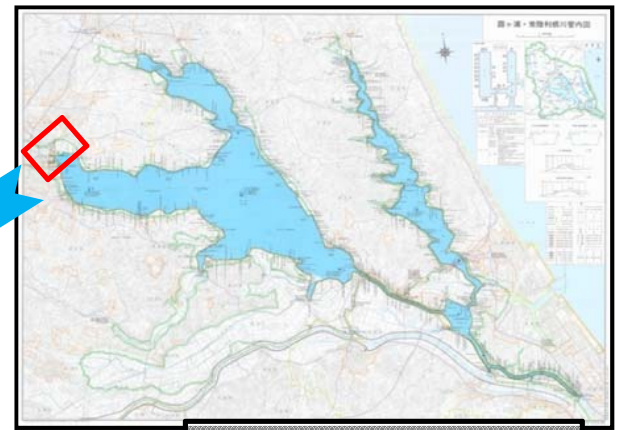
みずすましアオコ回収状況②