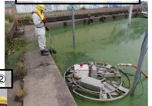
みずすましアオコ回収状況②