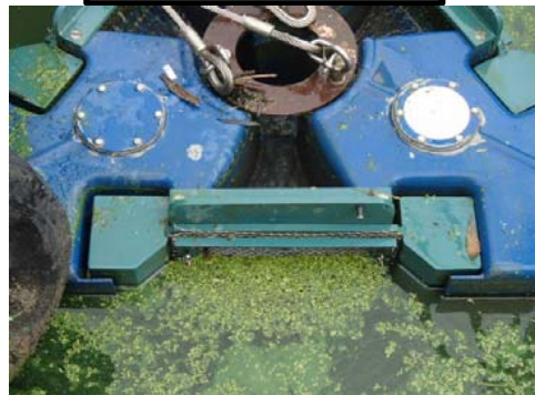
水馬アオコ回収状況①