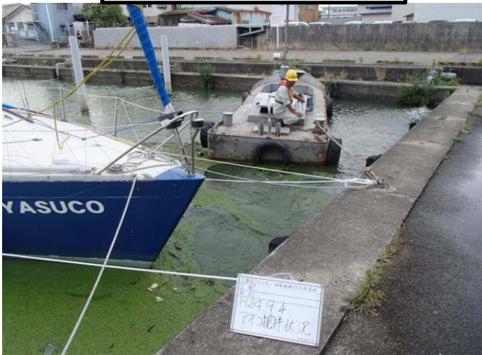
作業船によるアオコ攪拌作業①