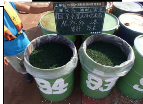
水馬脱水アオコ2本