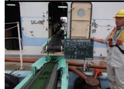
水馬脱水アオコ2本