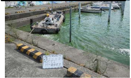
作業船によるアオコ攪拌作業⑤