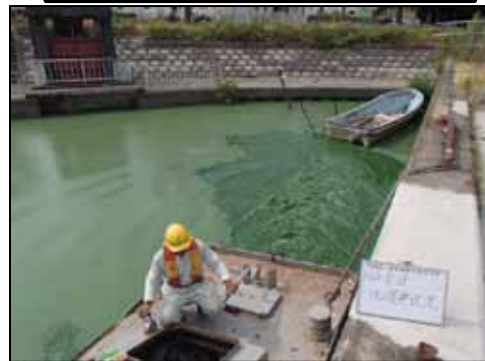
作業船によるアオコ攪拌作業