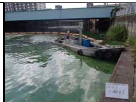
作業船によるアオコ攪拌作業