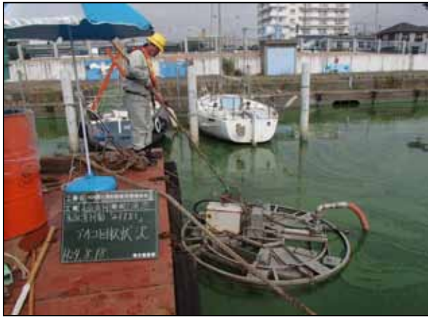
みずすましアオコ回収状況