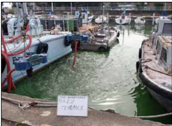
作業船によるアオコ攪拌作業