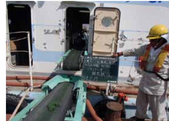
みずすまし脱水アオコ1本