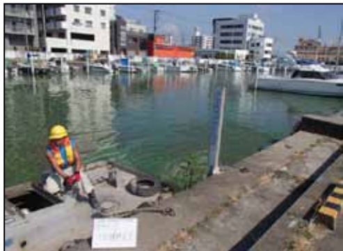
作業船によるアオコ攪拌作業