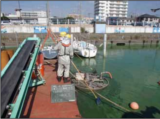
みずすましアオコ回収状況