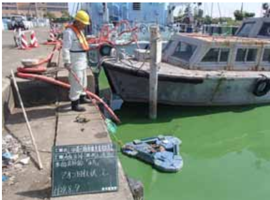
水馬アオコ回収状況