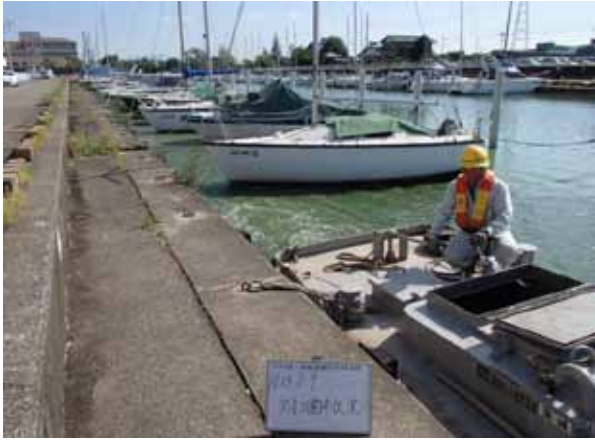
作業船によるアオコ攪拌作業