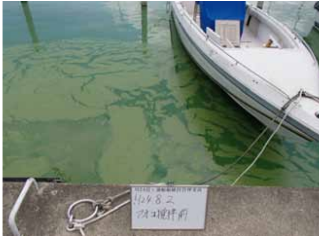
作業前アオコ発生状況