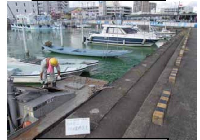
作業船によるアオコ攪拌作業