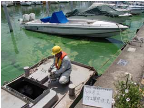
作業船によるアオコ攪拌作業