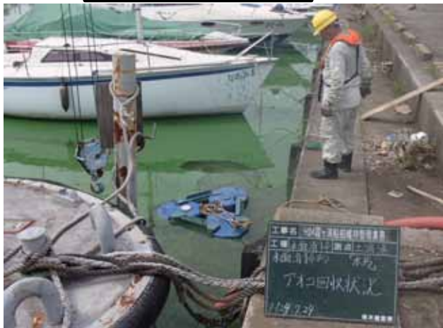
水馬アオコ回収状況