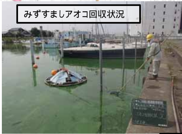
みずすましアオコ回収状況