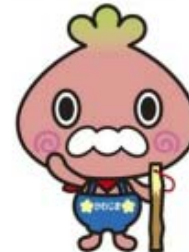
かわべえ (川島町HPより)