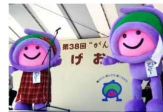
あっぴー