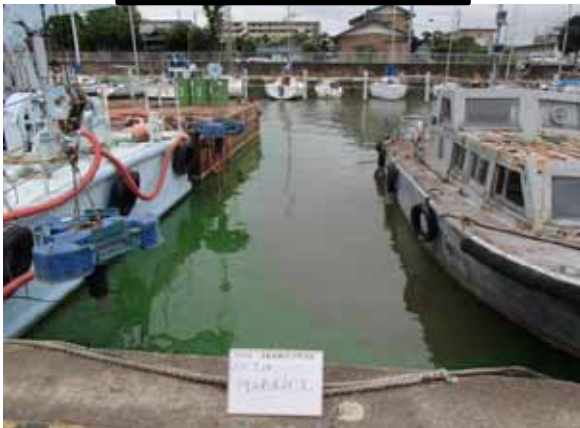
作業前アオコ発生状況